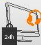
SIMPLY SMARTER 24/7