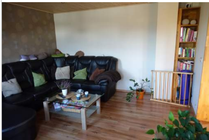
Wohnzimmer 1. OG