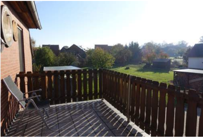
Balkon 1. OG

Zimmer: 8,00 Wohnfläche ca.: 200,00 m 2 Kaufpreis: 169.000,00 EUR