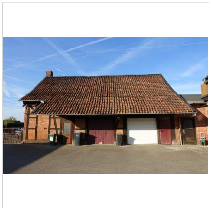
Garagen + Abstellraum