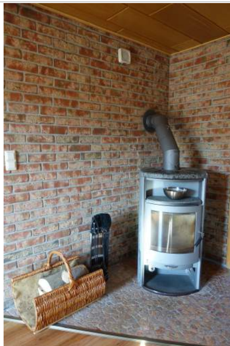
Kamin 1. OG