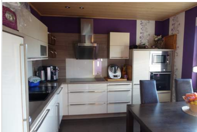
Küche 1. OG