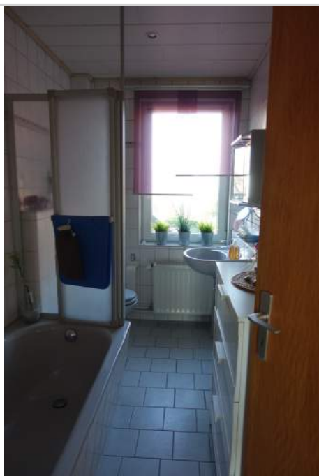
Gäste-WC 1. OG