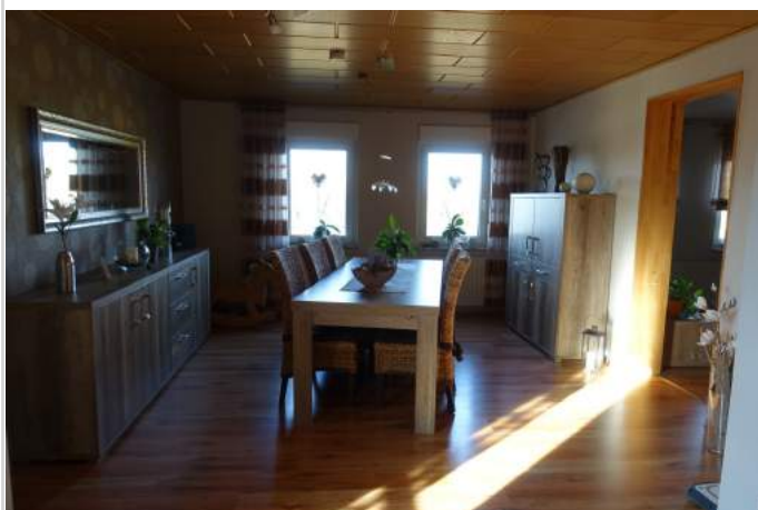
Esszimmer 1. OG

Zimmer: 8,00 Wohnfläche ca.: 200,00 m 2 Kaufpreis: 169.000,00 EUR