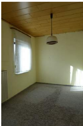
Zimmer EG (Küchenanschluss vorhanden)